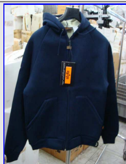
Felpa Termica Uomo Vintage Made in Italy